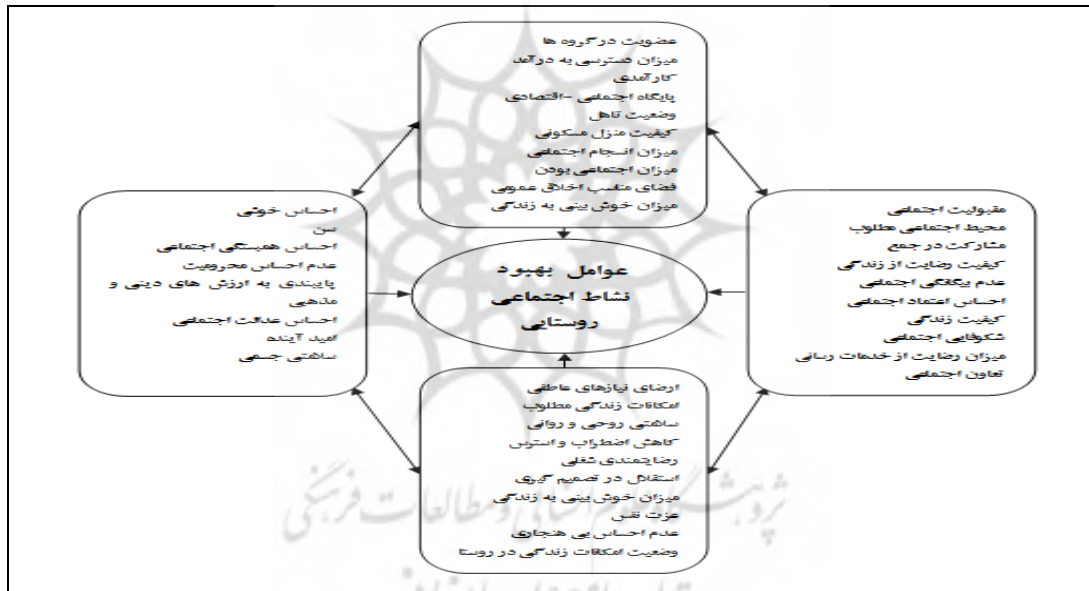
شکل ۱- متغیرهای تحقیق