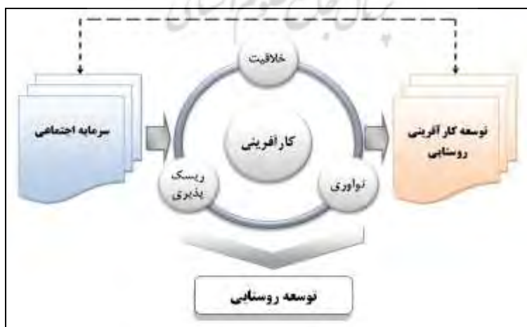
شکل ۱- الگوی ارتباطی سرمایه اجتماعی و توسعه کارآفرینی روستایی (مدل مفهومی تحقیق)