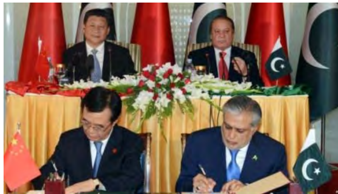
شکل ۵: امضای قرارداد سرمایه‌گذاری ۴۶ میلیارد دلاری چین در گوادر پاکستان