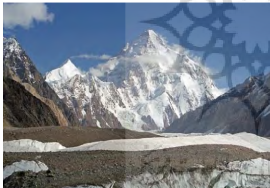
شکل ۲. (b): ارتفاع کی ۲ واقع در رشته کوه قراقو روم کشمیر پاکستان

آسیب‌پذیرترین مرزهای چین، مرز ۸۵۸ کیلومتری با قرقیزستان و ۴۱۴ کیلومتری با تاجیکستان است که محل نفوذ اسلام‌گرایان افراطی می‌باشد. همچنین ۵۲۳ کیلومتر مرز چین با پاکستان به دلیل گذر از