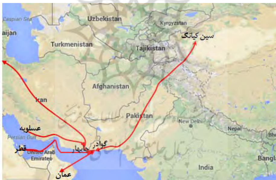
شکل ۴: نمایش مسیر ارتباطی استان سین کیانگ چین به بندر گوادر پاکستان

در حال حاضر ایران محدودیت ورود خارجی‌ها به منطقه‌ی چابهار را برای جلب سرمایه‌گذاری کاهش داده است. مانند معافیت مالیاتی به مدت ۲۰ سال- کاهش تعرفه‌های گمرکی و تضمین ۱۰۰ درصدی بازگشت سرمایه و سود ناشی از آن. حدود دو هزار شرکت که نیمی از آنها از پاکستان- افغانستان و کشورهای عرب حوزه‌ی خلیج فارس هستند در این منطقه حضور دارند از طرفی با توجه به برنامه‌های راهبردی تعریف شده در کشور هم‌اکنون ایران در نظر دارد که این منطقه را به مرکز فعالیت پتروشیمی- خودروسازی- پالایشگاه- فولاد- آلومینیوم- شیلات- ترانزیت - گمرک و گردشگری تبدیل کند.