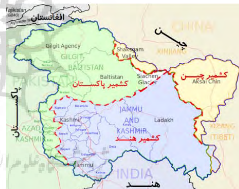
شکل ۲. (a): معرفی جغرافیای سرزمینی کشمیر

در مورد پاکستان، هند مهمترین محور تهدید بیرونی پاکستان است (کریمی‌پور، ۱۳۹۳: ۲۱۳). پاکستان جهت اصلی تهدید خود را در وهله‌ی نخست در مرزهای خاوری از ناحیه هند و سپس شمالی از ناحیه افغانستان می‌داند (کریمی‌پور، ۱۳۹۳: ۲۱۶). چرا که در این نواحی مرزی با افغانستان در حال نبرد با طالبان است. مرز افغانستان پس از هند، دومین منبع تهدید تاریخی برای تمامیت ارضی کشور پاکستان به حساب می‌آید، اسلام آباد در دو دهه‌ی اخیر بخش عمده‌ای از انرژی خود را به سوی افغانستان سوق داده است (کریمی‌پور، ۱۳۷۹: ۱۷۱). این نبردها در حالی ساری و جاری اند که اسلام آباد ناگزیر است در کشمیر و مرزهای طولانش با هند نیز تحرکات راهبردی دهلی نو را رصد نماید. در حوزه‌ی داخلی پاکستان نیز ایالت‌های بلوچستان و سرحد هیچگاه در سه دهه‌ی اخیر آرام نبوده‌اند (کریمی‌پور، ۱۳۹۳: ۸۶). تنها مرز ۹۷۸ کیلومتری پاکستان-ایران که از کوه ملک سیاه تا خلیج گواتر امتداد دارد، از نظر تهدید استراتژیک،