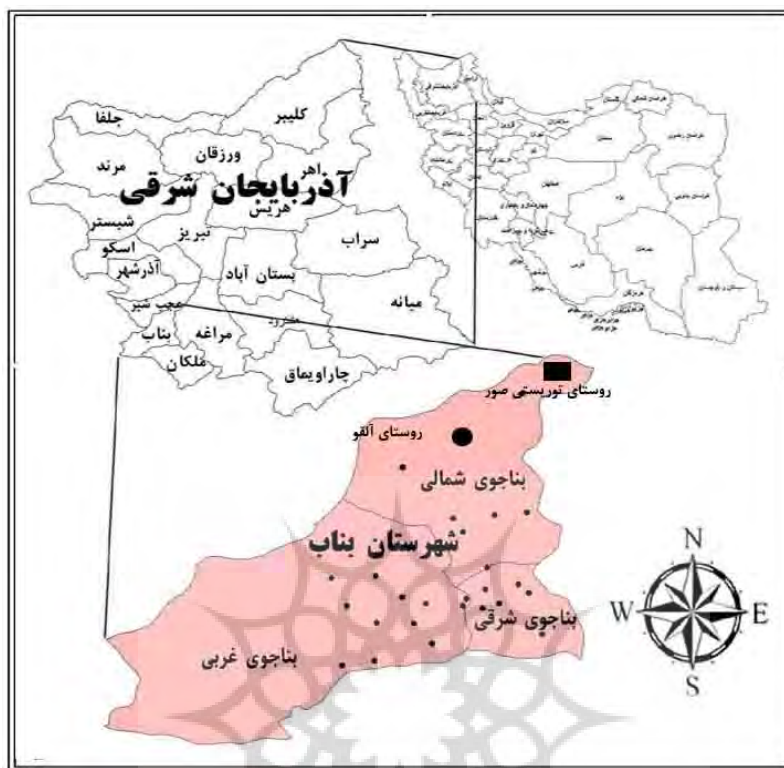
شکل ۲: موقعیت جغرافیایی روستای صور و آلقو