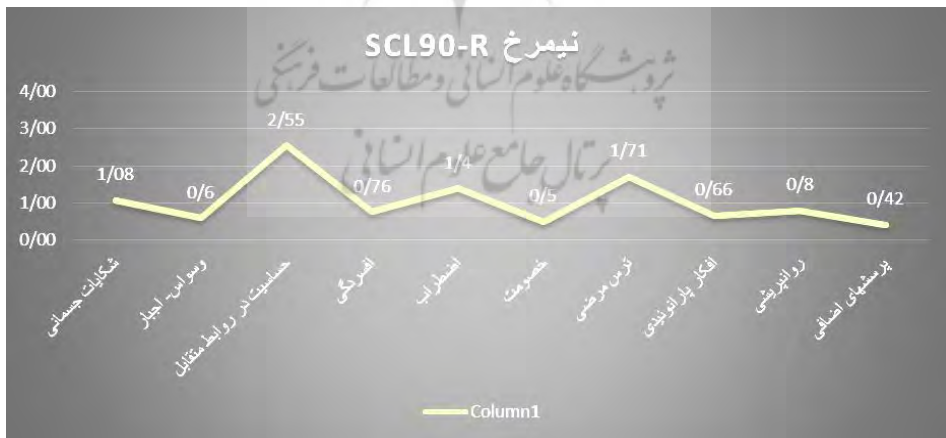
نمودار ۳. نیمرخ روانی آزمودنی در آزمون SCL-90-R قبل از مداخله

در مدت زمان ۱۴ دقیقه، آزمودنی به پرسشنامه SCL-90-R پاسخ داد. نتایج این آزمون با توجه به نمودار ۳، نشان داد که آزمودنی در شکایات جسمانی، اضطراب و ترس مرضی در وضعیت مرضی قرار دارد که خود وی نیز پذیرفت. همچنین، همان‌طور که نیمرخ این آزمون نشان می‌دهد، آزمودنی در حساسیت در روابط متقابل نمره بالایی نسبت به سایر مقیاس‌ها دارد و در حالت بیمار قرار دارد. حساسیت در روابط متقابل به احساس عدم کفایت و حقارت فرد به‌ویژه در هم‌سنجی با دیگران تأکید دارد. دست‌کم گرفتن خود، عدم آرامش، راحت نبودن و ناراحتی محسوس در جریان ارتباط با دیگران، از تظاهرات خاص این بعد است (خدا یاری فرد و پرند، ۱۳۹۱).