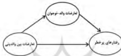
شکل ۱: دیاگرام مدل پژوهش

پژوهشی، مدلی تدوین شود که دو مورد از مهم‌ترین ناسازگاری‌های نوجوانان را بررسی کند که تحت تأثیر تعارضات بین‌والدینی است. اولین ناسازگاری که نقش میانجی دارد و تحت تأثیر تعارضات زناشویی است، به متغیر تعارض والد-نوجوان مربوط می‌شود و دومین ناسازگاری رفتاری نوجوان مربوط به گرایش به رفتارهای پرخطر است که هم تحت تأثیر تعارضات والد-نوجوان و هم به صورت مستقیم و غیرمستقیم تحت تأثیر تعارضات بین‌والدینی است، که دیاگرام مدل به شرح زیر ارائه می‌شود: