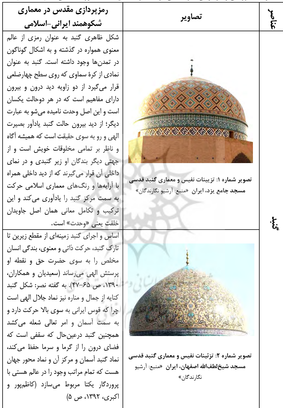
جدول ۱: بررسی و بازخوانی هنر قدسی در عناصر کالبدی مساجد دوره اسلامی