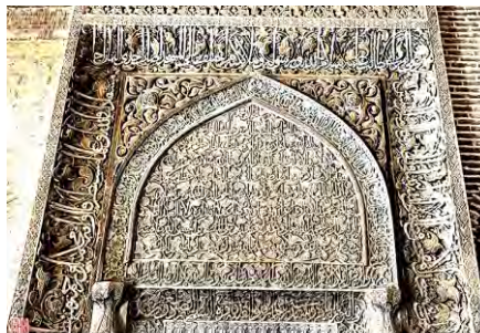
تصویر شماره ۵: تزیینات بی‌همتای محراب اولجایتو در مسجد جامع اصفهان، اصفهان، ایران.

از نظر بزرگوارت؛ اساس معماری محراب در مساجد اسلامی به مظاهر یادشده در فرهنگ دینی و کتاب آسمانی بر می‌گردد. شکل آن با طاق‌های نمودار آسمان و آخرت و کف آن بر زمین طاقچه با فرورفتگی، همانند غار زمین و دنیا است (مددیور، ۱۳۸۷، ص ۲۶۰) کسی می‌تواند این فضای نمادین میان آسمان و زمین را پر کند که رهبری و هدایت مردم را به سوی حقیقت (قبله) و صدایش در فضای محراب پیچیده و به گوش سایرین می‌رسد (موسوی، ۱۳۹۲، ص ۶۸). طی طریقت نیازمند رهبری است که انسان را به راه آشنا کند.