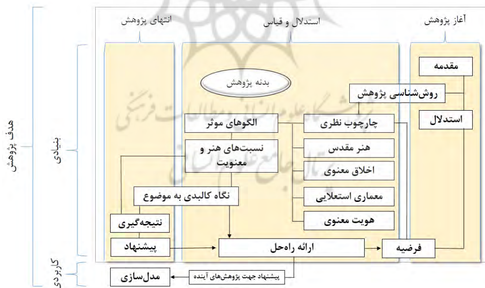
نمودار ۱: ساختار پژوهش «طرح و ترسیم: نگارندگان»

در تمامی پژوهش‌ها دو گونه کمی و کیفی مراحل کار را پیش می‌برد؛ و این در حالی است که در بخش اول به سبب قیاس و بدون دخالت آرای پژوهشگر قابل حصول است و دیگری با حرکت قیاسی محتوا را آشکار می‌سازد همان‌گونه که استوارت چپین چهار دسته را برای انجام پژوهش معرفی می‌کند که عبارت‌اند از: تشریحی که پیرامون عمق درونی موضوع می‌گردد، توصیفی که به شکل بیرونی موضوع نظر دارد، شبیه‌سازی که مانند نمونه‌ای مفهومی عمل می‌نماید و مقایسه‌ای که به واسطه معیارهای از پیش تعریف‌شده در موضوع پژوهش ارزیابی می‌گردد (اسلامی، ۱۳۹۲، ص ۴۱-۵۵) با توجه به مطالب ذکر شده این پژوهش؛ از نوع راهبرد ترکیبی بهره برده و راهبر آن روش کیفی و احتجاجات آن استنتاجی‌اند به عبارت دیگر: نگارندگان با تفحص و تحقیق در اصل هنرهای قدسی با توجه به کتب موجود به جمع‌آوری مستندات براساس مرور مطالعات کتابخانه‌ای پرداخته و پس از مصاحب با افراد صاحب‌نظر در این حیطه، به صورت کاربست استدلال منطقی به شناخت این هنر مقدس و معنوی پرداخته و مقصود این تصنیف ساده، پرواز در هنرهای استعلایی معماری ایرانی-اسلامی‌ست که در نمودار شماره ۱ به صورت کلی به نمایش درآمده است: