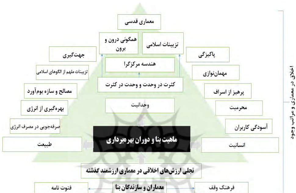
نمودار ۲: مراحل سه‌گانه ارزش‌های اخلاقی جهت هم‌راستا شدن با هنرهای قدسی

در توجه به سه اصل خدا محوری، انسان محوری و بوم محوری مشاهده نمود؛ چنانکه از طرفی به بیان تأثیر منش سازندگان بر فرآیند ساخت و از طرف دیگر به ارتباط بین ماهیت بنا و نحوه زندگی کاربر پرداخته می‌شود؛ در نمودار شماره ۲ این نمود به صورت کلی به نمایش درآمده است: