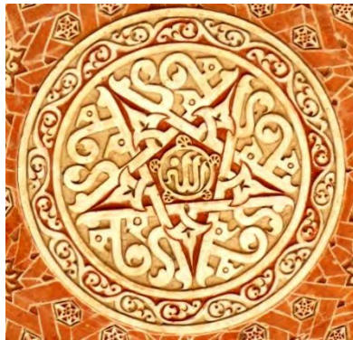
تصویر شماره ۳: نقش ستاره پنج پر، متن خط: الله، از نقوش بی‌همتای نمای داخلی گنبد سلطانیه در زنجان، ایران.

معماران و هنرمندان مسلمان در بسیاری از آثار خود مفهوم کثرت در وحدت و وحدت در کثرت را با استفاده از این طرح به زبان رمزی بیان می‌کردند. این نقش در معماری اسلامی به ویژه در نمای مساجد کاربرد گسترده پیدا کرده است، چرا که صورت‌گیری و مجسمه‌سازی و کلاً ترسیم اشکال جاندار مورد تحریم قرار گرفت که مبارزه با بت‌پرستی از ادله در این مورد است (شکاری نیز، ۱۳۷۸، ص ۲۵۲)