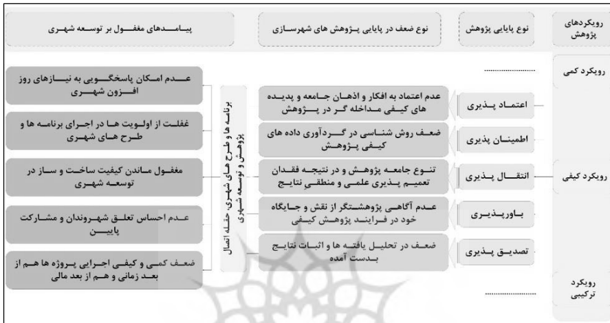
شکل (۶) - فرایند تأثیرپذیری طرح‌های توسعه شهری از ضعف‌های روش‌شناسی پژوهش

استوار است، با تأثیرگذاری منفی بر طرح‌ها و برنامه‌های توسعه شهری که در حقیقت حلقه اتصال حوزه پژوهش و حوزه توسعه عملی شهرسازی است؛ پیامدهایی به صورت مستقیم و غیرمستقیم بر کالبدی فضایی و کنش‌های اجتماعی بین شهروندان، به دنبال دارد. این فرایند به صورت شماتیکی و نمودار در شکل زیر قابل بیان است.