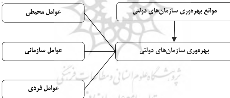
شکل (1) - مدل مفهومی تحقیق