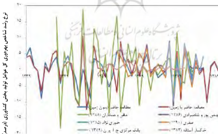
شکل (1) نرخ رشد شاخص بهره‌وری کل عوامل تولید بخش کشاورزی در مطالعه حاضر و سایر مطالعات

پس از برآورد سهم نهاده، رشد شاخص بهره‌وری کل عوامل تولید در دو حالت با و بدون وجود نهاده زمین بر اساس الگوی مانده سولو (1957، 112-120) مورد برآورد قرار گرفته است. شکل (1) روند رشد شاخص بهره‌وری کل عوامل تولید برای بخش کشاورزی ایران (بر حسب درصد) نشان می‌دهد. لازم به ذکر است به منظور مقایسه روند رشد بهره‌وری این مطالعه (با زمین و بدون زمین) با سایر مطالعات، روند رشد بهره‌وری محاسبه شده توسط بانک مرکزی ج.ا. ایران (16، 1389)، صفری (1389، 114)، مافی و دیگران (1388) تهمی پور و شاهمرادی (328، 1386)، خاوری‌نژاد (1385، 33) و خاکسارآستانه (46، 1383) نشان داده شده است.