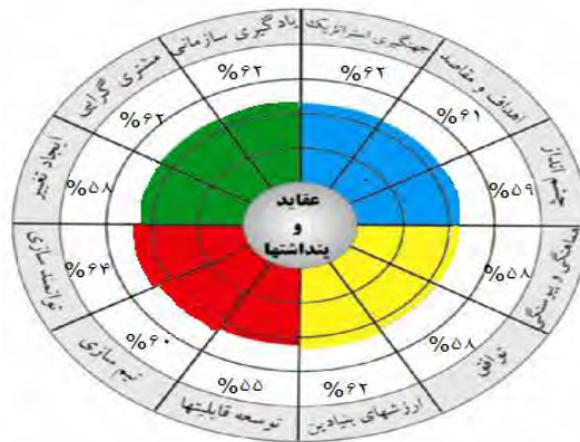
شکل 4 - تصویر کلی سازمان

تفسیر بعد رسالت: همان گونه که نتایج نشان می دهند نمرات شاخص های بعد رسالت به ترتیب شامل گرایش (62 درصد)، اهداف (61 درصد) و چشم انداز (59 درصد) است. زمانی که نمره گرایش بالاتر از اهداف باشد، این موضوع بیان کننده این است که سازمان ممکن است از نظر زمانی برای اجرایی کردن و عملی کردن رسالت خود دچار مشکل باشد. در منصب قدرت ممکن است رویا پردازانی برجسته وجود داشته باشند که برای تبدیل رویاها به واقعیت از لحاظ زمانی دارای مشکل باشند. احساس قوی و روشن سازمانی از رسالت بر بهره وری اثر گذار است. برای آنکه افراد در سازمان ها بیشتر بتوانند به سوی اهداف مورد نظر خود حرکت کنند، نیازمند یک هماهنگی و اشتراک مساعی هستند. لذا، این موضوع می تواند در یک قالب کلی در سایه به کارگیری گسترده فرهنگ بهره وری در محیط کار حاصل گردد.