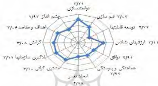
شکل 3- شکل راداری میانگین کلی امتیاز شاخص‌ها

صندوق ضمانت صادرات ایران، بیشترین امتیاز را در شاخص توانمندسازی کسب نموده است که نسبت به سایر شاخص‌ها حد مطلوب تری دارد. همچنین کمترین امتیاز را در شاخص توسعه قابلیت‌ها به دست آورده است که نسبت به سایر شاخص‌ها مطلوبیت کمتری را نشان می‌دهد. همچنین، نمودار راداری تصویری کلی از امتیازات حاصله را برای کل سازمان بر اساس شاخص‌های دوازده گانه فرهنگ سازمانی مورد مقایسه قرار داده است.