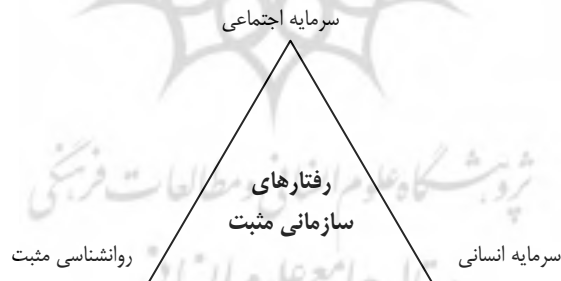
شکل (۱): عوامل تشکل دهنده رفتارهای سازمانی مثبت

عوامل تشکل دهنده رفتارهای سازمانی مثبت را می‌توان در زیر مشاهده کرد: