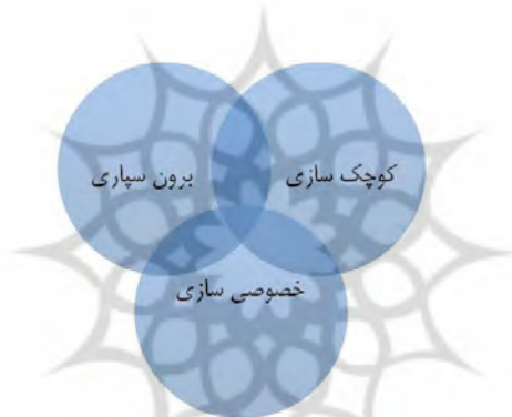
شکل (۲) - ارتباط میان مفاهیم سه گانه برون سپاری، خصوصی سازی و کوچک سازی (رهنورد، ۱۳۸۲، ۲۸-۳۰)

تفاوت برون سپاری با خصوصی سازی و کوچک سازی این پرسش که آیا برون سپاری، خط مشی متفاوت از خصوصی سازی یا کوچک سازی محسوب می‌شود، ایجاب می‌کند که به تفاوت بین این مفاهیم به اختصار پرداخته شود. به طور کلی، مراجعه به مفاهیم این اصطلاحات مدیریتی نشان می‌دهد که کانون توجه تعاریف برون سپاری خصوصی سازی و کوچک سازی به ترتیب عبارتند از: رهایی از فعالیت‌های غیر استراتژیک، واگذاری مالکیت به بخش خصوصی و کاهش نیروی انسانی سازمان، البته در روش‌های انتخابی برای اعمال این مفاهیم، مقاطع مشترکی دیده می‌شود که بعضاً تمیز بین آنها را با دشواری همراه می‌سازد و بی‌جهت نیست که در پاره‌ای از مواقع این واژه‌ها به طور غیرعمد به عنوان مترادف همدیگر به کار گرفته می‌شوند (شکل ۲).