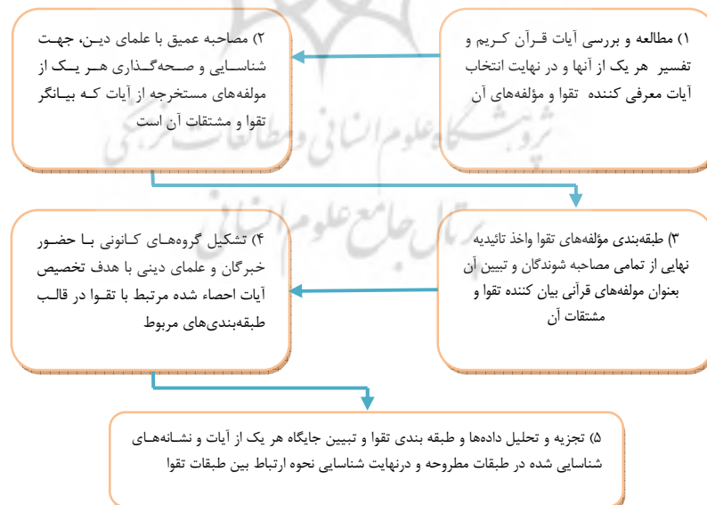
شکل ۱: فرآیند انجام تحقیق

برای پاسخ به سؤالات پژوهش و بررسی مدل مفهومی، فرآیند مندرج در شکل زیر به عنوان الگوی انجام کار طی ۵ مرحله مدنظر قرار گرفت.