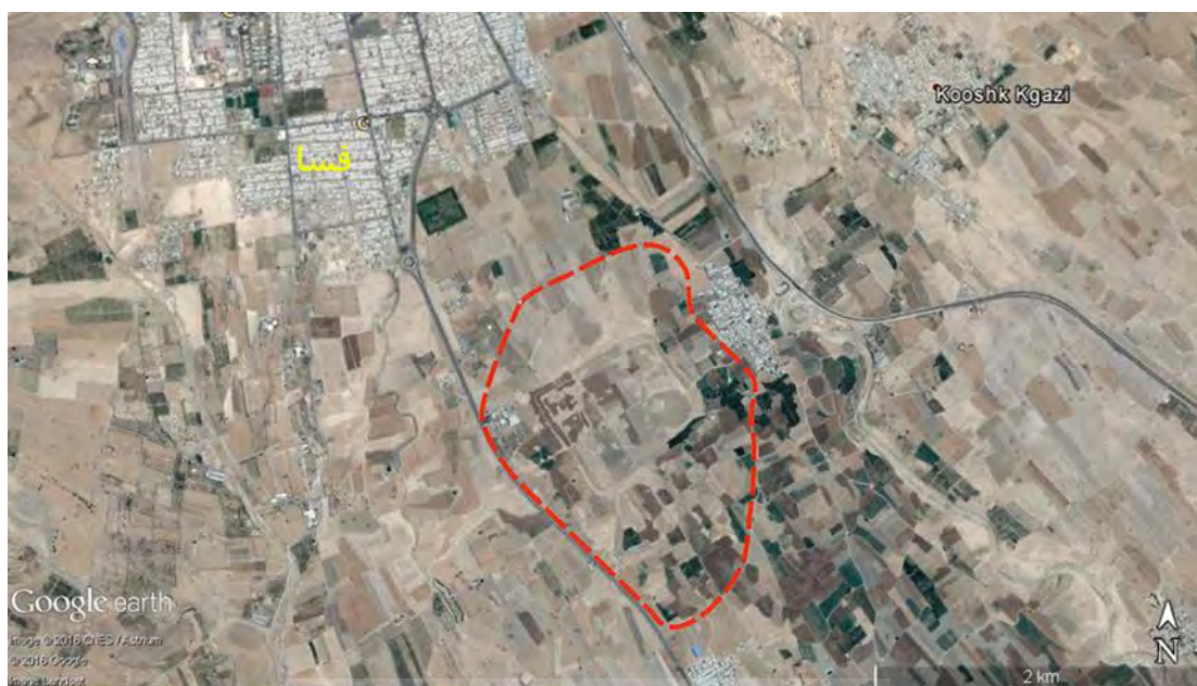
محدوده تقریبی شهر باستانی فسا

شکل ۳. عکس هوایی محوطه تل ضحاک فسا و محدوده تقریبی آن