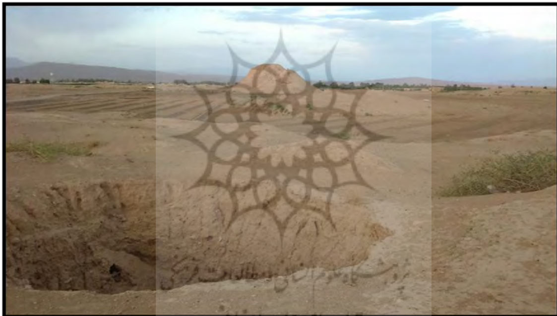
شکل ۲. محوطه تل ضحاک فسا، دید از غرب.