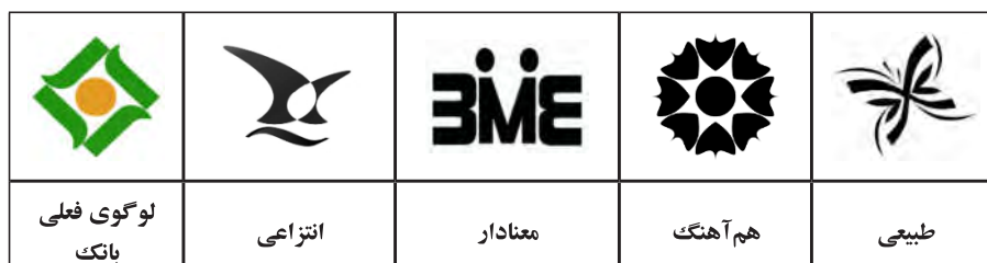
جدول ۲- طرح‌های به کار گرفته شده در این پژوهش

نظریه شبه‌انسان‌گرایی ۱ بیان می‌کند که مردم تمایلی طبیعی دارند تا برندها را واقعیتی انسان‌گونه ببخشند. در واقع خصیصه‌های انسانی را به اشیای غیرانسانی تسری دهند (گوثریه ۲ ، ۱۹۹۷). بر اساس همین منطق، می‌توان چرخه زندگی برندها را با چرخه زندگی انسان‌ها مقایسه نمود. هر برندی تاریخ تولدی دارد (ارایه برند به بازار)، دوران کودکی‌ای دارد (سال‌های اولیه)، دوران بلوغ خود را سپری می‌کند (و مشکلات بالقوه سر باز می‌کنند)، ازدواج می‌کند (از طریق ادغام یا تملیک) و مسن‌تر می‌شود (سهم بازارش کاهش پیدا می‌کند و فروشش کم و کم‌تر می‌شود) و سرانجام می‌میرد (این امر به دلیل مدیریت نامناسب و کم‌اثر رخ می‌دهد) (لهوو، ۲۰۰۴؛ آکر، ۱۹۹۷). جوان‌سازی، مزیت تطبیق‌پذیری لوگوها را در بر دارد؛ برخلاف نام برند، شرکت‌ها این امکان را دارند تا لوگوهای خود را در هر زمانی به‌روز کنند.