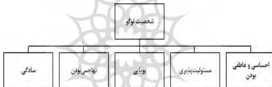
شکل ۱- ابعاد شخصیت لوگو

یاد شده که توسط پاینه (۲۰۱۳) صورت گرفت، نتایج حاکی از آن بود که طرح لوگو بر شخصیت لوگو موثر بوده است (به‌طور مثال، طرح‌های طبیعی لوگو، دارای شخصیتی پویا و احساسی هستند و طرح‌های هم‌آهنگ، از سادگی خاصی برخوردارند) و شخصیت درک‌شده از طرح لوگو، بر قصد خرید مصرف‌کننده تأثیر می‌گذارد. به‌طور قطع، شخصیت قایل‌شده برای یک لوگو، بر اساس استنباطی است که افراد از طرح لوگو برداشت می‌کنند؛ بخصوص در این پژوهش که لوگوهای به‌کار گرفته‌شده ناآشنا بوده و هیچ پیش‌زمینه‌ی ذهنی در مخاطب ایجاد نمی‌کردند. شخصیت لوگو طبق پژوهش‌های قبلی (پاینه ۱ ، ۲۰۱۳؛ گوئنز، ۲۰۰۹) دارای پنج بُعد به شرح زیر است، که در شکل ۱ ترسیم گردیده است: