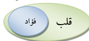
شکل ۳: رابطه قلب و فؤاد

گرفته‌ایم که با مؤلفه‌های اضافه‌تری از معنا، نشان‌دار و خاص می‌شود که به آن «فؤاد» گفته می‌شود.