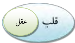
شکل ۲: رابطه عقل و قلب

۱۴۰۷ ق، ج ۸، ص ۱۹۰)، محل سکونت و استقرار عقل قلب است.