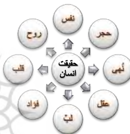
شکل ۴: رابطه معنایی حقیقت انسان با معانی نفس انسان

شکل زیر رابطه معنایی حقیقت انسان با معانی نفس انسان، روح، قلب، عقل، نهی، حجر، فؤاد و... را بیان می‌کند.