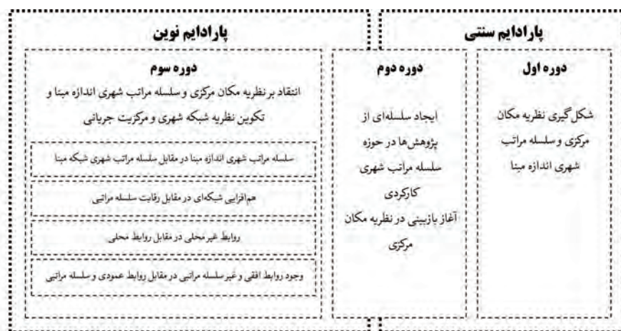
شکل ۱. سیر تحولات تاریخی نظریات و دیدگاه‌های مرتبط