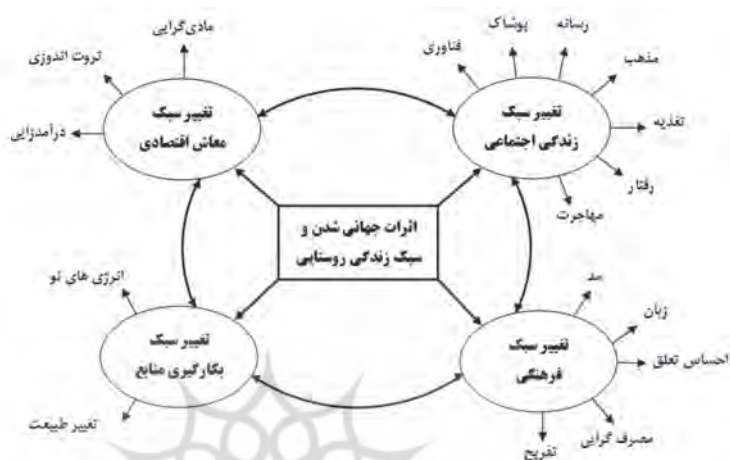
شکل ۲. مدل مفهومی اثرات جهانی شدن بر تغییر سبک زندگی (نگارندگان، ۱۳۹۳)

تغییرات سبک زندگی روستایی را به صورت ملموس در تغییر سبک معاش اقتصادی روستاییان، تغییر سبک زندگی اجتماعی، تغییر سبک فرهنگ روستایی و تغییر در سبک استفاده از محیط و منابع محیطی مشاهده کرد (شکل ۲).