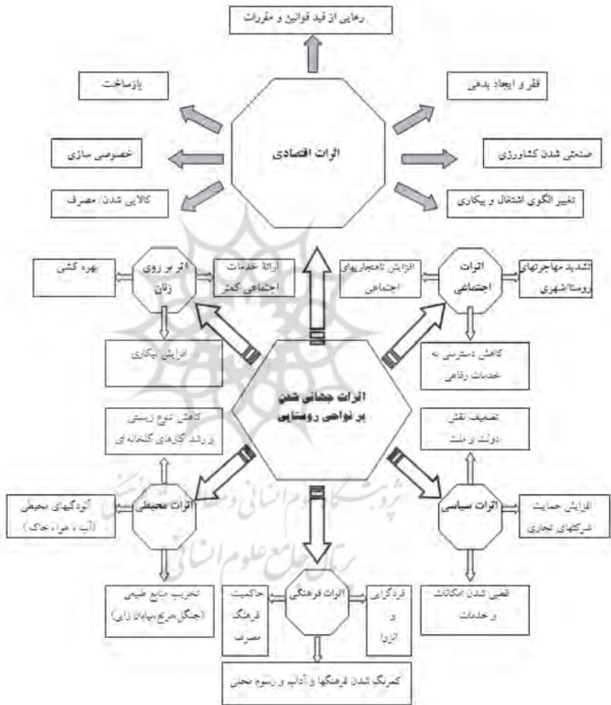
شکل ۱. اثرات جهانی شدن بر نواحی روستایی (طاهرخانی، ۱۳۸۳: ۱۰۷)

«محیط‌های ناسالم از نظر اکولوژیکی» ۱ هستند. «هزینه‌های سنگین آلودگی» ۲ ، زیاده‌های حاصل از فرایند تولید و استفاده بی‌رویه از منابع طبیعی به‌ویژه انرژی، تخریب اراضی جنگلی، کاهش تنوع زیستی، بیابان‌زایی، تخریب اراضی و رشد سریع گازهای گلخانه‌ای، نمونه‌هایی از اثرات محیطی جهانی شدن در جوامع روستایی محسوب می‌شوند.