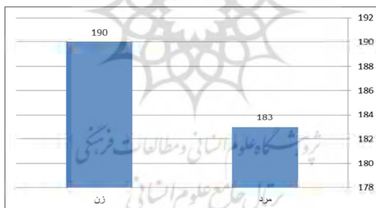
نمودار ۱: توزیع فراوانی نمونه به تفکیک جنسیت