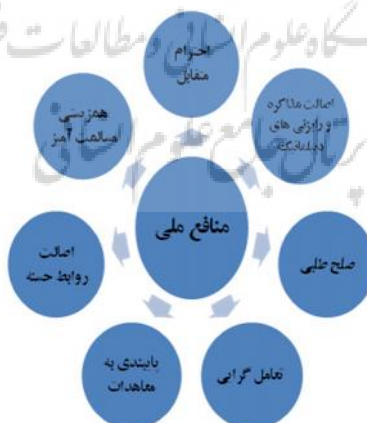
شکل (۵) سامانه مفصل‌بندی نشانگان دیپلماتیک در گفتمان سیاست خارجی امام خمینی

جمهوری اسلامی در سایه رهبری امام خمینی، پس از هژمونی‌یابی بر پهنه گفتمانی کشور، اندک‌اندک رویه مثبت‌تری نسبت به اصول موضوعه و اولیه دیپلماتیک، به‌ویژه نسبت به مستضعفین و کشورهای اسلامی و غیرمتعهد از خود نشان داد. زاویه دیپلماتیک گفتمان سیاست خارجی امام خمینی ناظر بر کنش‌های استوار بر الگوهای پذیرفته شده گفتگو و مذاکره می‌باشد. این پهنه، جایگاه نمودیابی مصلحت‌گرایی و نوگرایی در گفتمان ایشان بوده، که به‌گرد نشانه مرکزی منافع ملی مفصل‌بندی شده است. به‌باور امام خمینی: «در اسلام مصلحت نظام از مسائلی است که مقدم بر هر چیز است، و همه باید تابع آن باشیم» (صحیفه امام، ۱۳۷۸، ج ۲۱: ۳۳۵). این مصلحت‌ایجاب می‌کند که در کنار پاسداری از ارزش‌ها و باورداشت‌ها، قواعد پایه نظام بین‌الملل که از دید اسلام نیز پذیرفته است، را بستری برای تعامل و گفتگو با جهان قرار داد. نشانه‌ها و دال‌های دیپلماتیک برجسته دیگر در گفتمان سیاست خارجی امام خمینی عبارتند از: احترام متقابل؛ اصالت روابط حسنه؛ عدم مداخله؛ صلح‌طلبی؛ همزیستی مسالمت‌آمیز؛ پایبندی به معاهدات و تعهدها؛ اصالت مذاکره و رایزنی‌های دیپلماتیک؛ تعامل‌گرایی؛ تنش‌گریزی (جلوگیری از انزوا و تحریم) و ... .