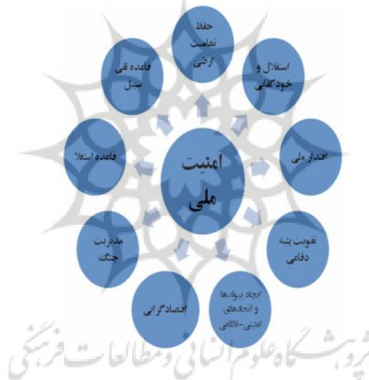
شکل (۴) سامانه مفصل‌بندی نشانگان استراتژیک در گفتمان سیاست خارجی امام خمینی

واقع‌گرایانه و عمل‌گرایانه در گفتمان سیاست خارجی ایشان است. چنان‌که بیان شد، برجسته شدن این مبانی در گفتمان سیاست خارجی جمهوری اسلامی بیش از هر چیز برآیند برخورد نظام، با واقعیات موجود در پهنه منطقه‌ای و بین‌المللی و درک موقعیت تازه راهبردی و ژئواستراتژیک ایران، بوده که زمینه بازنگری در انتساب دال‌ها، مدلول‌ها و مصادیق را فراهم آورده است. نشانه مرکزی این حوزه را مفهوم امنیت ملی می‌سازد که نشانگان اقتدار ملی؛ استقلال و خودکفایی؛ حفظ تمامیت ارضی؛ تقویت بنیه دفاعی؛ ایجاد پیوندها و اتحادهای امنیتی - نظامی؛ قاعده نفی سبیل؛ قاعده استعلا؛ مدیریت جنگ و جهاد؛ اقتصادگرایی؛ دانش‌افزایی در راستای افزایش قدرت ملی و... به گرد آن می‌گردند.