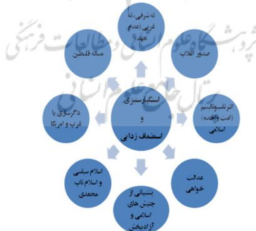
شکل (۳) سامانه مفصل‌بندی نشانگان ایدئولوژیک در گفتمان سیاست خارجی امام خمینی

ایدئولوژی در گفتمان سیاست خارجی امام خمینی ناظر بر کنش‌های استوار بر اسلام انتقادی- انقلابی و برآمده از بنیان‌های جهان‌بینی، شناخت‌شناسانه، انسان‌شناختی و فرجام‌شناسانه خاص است. برون‌دادهای این صورت‌بندی گفتمان خود را در گزاره‌ها و کنش‌های مکتب‌گرایانه، آرمان‌گرایانه و وظیفه‌گرایانه نشان می‌دهد. نشانه مرکزی گفتمان ایدئولوژیک امام خمینی را استکبارستیزی و استضعاف‌زدایی می‌سازد. از دیگر نشانگان ایدئولوژیک برجسته آن نیز می‌توان از انگاره‌های نه شرقی، نه غربی (عدم تعهد)؛ صدور انقلاب؛ اسلام سیاسی؛ اسلام ناب محمدی؛ انترناسیونالیسم (امت واحده) اسلامی؛ سیاست نگاه به شرق؛ باور به مرکزیتی میان خودی و غیرخودی (دارالاسلام و دارالکفر)؛ دگرسازی با غرب و به‌ویژه آمریکا؛ مسأله فلسطین و غیرت‌سازی با اسرائیل؛ معنویت‌گرایی و باور به نصرت الهی؛ عدالت‌خواهی؛ ستم‌ستیزی؛ پشتیبانی از جنبش‌های اسلامی و آزادی‌بخش؛ باور به تهاجم فرهنگی؛ عزت‌مداری و... نام برد.