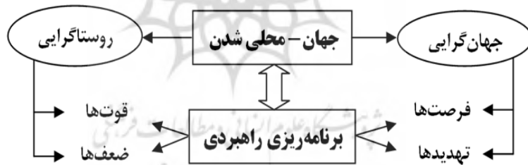
شکل ۱- پیوند جهانی شدن و برنامه‌ریزی راهبردی

بنابراین، به‌ناچار، جهانی شدن، اثراتی بر جوامع روستایی به دنبال دارد که دربرگیرنده فرصت‌ها و تهدیدهایی برای جوامع روستایی هست. لذا برای افزایش نقش‌آفرینی روستاها در روندهای جهانی و همچنین حذف نشدن جامعه روستایی در روندهای جهانی، توجه به مدیریت میزان اثرگذاری تحولات جهانی بر روستاها ضروری هست. برای این منظور، نیازمند داشتن روش برنامه‌ریزی مناسب و آینده‌نگر هست تا از این طریق اثرات مثبت افزایش یابد؛ زیرا جهانی شدن روستاها بستر مواجهه شدن نیروهای محیط بیرونی (فرصت‌ها و تهدیدهای جهانی) و نیروهای محیط درونی (قوت‌ها و ضعف‌های محلی) هست (شکل ۱).