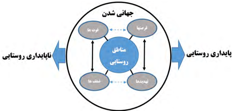
شکل ۲- جهانی‌شدن روستاها و فرصت‌ها، تهدیدها، ضعف‌ها و قوت‌ها

هست تا آثار مثبت آن به حداکثر افزایش و آثار منفی به حداقل کاهش یابد. برای این منظور بهره‌گیری از فرصت‌ها و قوت‌ها به‌عنوان هدف اصلی در مدیریت جهانی‌شدن روستاها هست (شکل ۲).