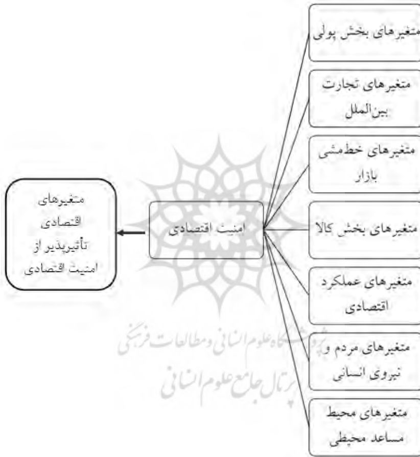
شکل ۲: الگوی کلی سنجش امنیت اقتصادی

بر اساس نتایج به دست آمده از تحلیل محتوای اسناد و کدگذاری و مقوله‌بندی، در نهایت الگوی مفهومی تأثیر متغیرهای فوق را می‌توان به صورت ذیل نشان داد: