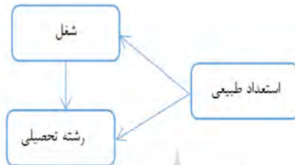
نمودار ۴. رابطه بین استعداد طبیعی، شغل و رشته تحصیلی

در مجموع رابطه بین استعداد طبیعی، شغل و رشته تحصیلی در اندیشه رهبر معظم انقلاب مطابق با نمودار زیر است: