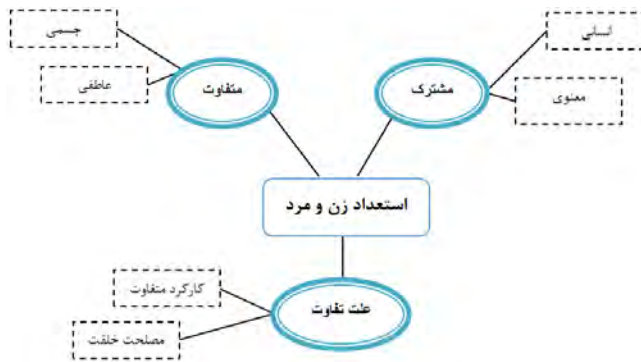
نمودار ۲. شبکه مضامین استعداد

از دیدگاه مقام معظم رهبری زن و مرد از حیث حقیقت انسانی و سرشت اولیه خلقت، استعداد معنوی و تقرب الی الله با یکدیگر تفاوتی ندارند ولی در حوزه‌های عاطفی و جسمانی از یکدیگر متفاوت هستند.