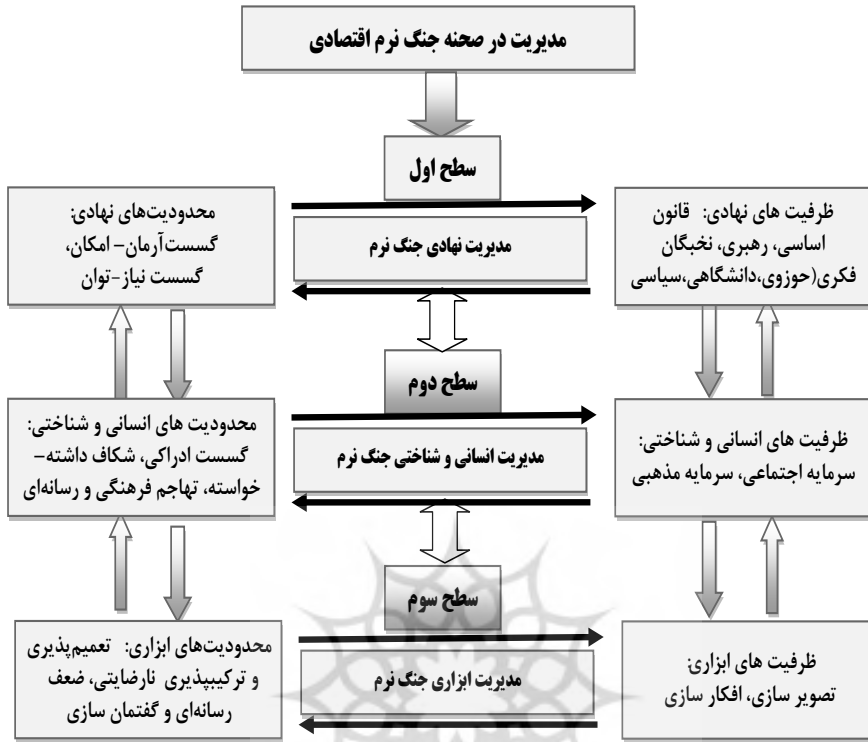
تصویر شماره ۲: نمونه شماتیک چارچوب مفهومی تحقیق

پژوهشگاه علوم انسانی و مطالعات فرهنگی پرتال جامع علوم انسانی