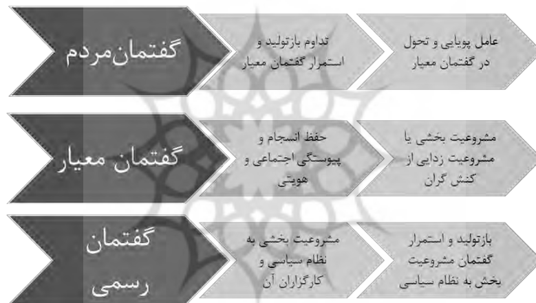
شکل (۲): گفتمان‌های سه‌گانه و کارکردهای آن‌ها

بنیادین گفتمانی میان کارگزاران مدنی گفتمان معیار و کارگزاران دولتی گفتمان رسمی است. با توجه به مفهوم‌پردازی‌های مذکور می‌توان گفت امنیت فرهنگی از دیدگاه مردم، شرایطی است که در آن امکان استمرار، بازتولید و پویایی گفتمان معیار وجود داشته باشد. از دیدگاه نظام سیاسی نیز امنیت فرهنگی شرایطی است که گفتمان فرهنگی مسلط بر مردم، با گفتمان فرهنگی مشروعیت‌بخش به نظام سیاسی سازگار باشد. بر این اساس، هر پدیده یا کنشی که موجب شکاف میان گفتمان معیار و گفتمان فرهنگی حاکم بر نسل زنده یک ملت شود یا موجب شکاف میان گفتمان معیار و گفتمان نظام سیاسی حاکم بر ملت شود و یا به شکاف میان گفتمان مورد نظر نظام سیاسی و گفتمان مسلط بر مردم بینجامد، تهدیدی علیه امنیت جامعه است.