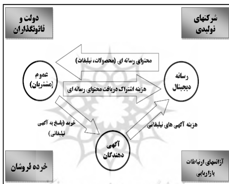
شکل ۱- الگوی سنتی کسب‌وکار رسانه، مک فیلیپس و مرلو (۲۰۰۸)

کاهش اثربخشی تبلیغات رسانه‌ای (۱) (همان، ص ۲۳۸). از این رو، ضرورت ایجاد می‌کند که الگو و چارچوب جدیدی با رویکرد رسانه‌های نوین دیجیتال برای این کسب‌وکار شناسایی و معرفی شود تا زمینه پرداختن به مطالعات بعدی در خصوص عوامل و بازیگران آن و همچنین تبیین تأثیرات میان آنها فراهم آید.