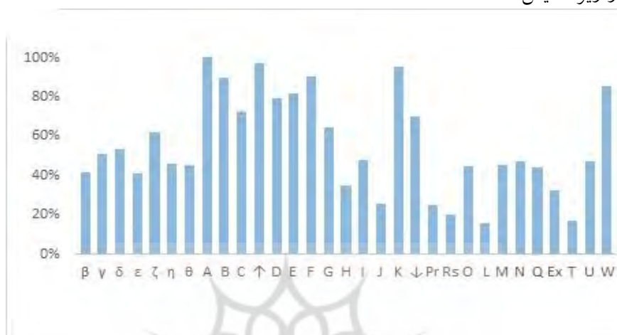
شکل ۱. بسامد خویشکاری‌ها

در همه قصه‌ها و حرکت‌ها دیده می‌شود. این خویشکاری در واقع، عامل اصلی ایجاد حرکت در قصه‌هاست و بدون آن گسترش قصه امکان‌پذیر نیست. در میان این خویشکاری‌ها، «ادعاهای دروغین» دارای کمترین بسامد است. بسامد خویشکاری‌ها در نمودار زیر نمایش داده شده است.