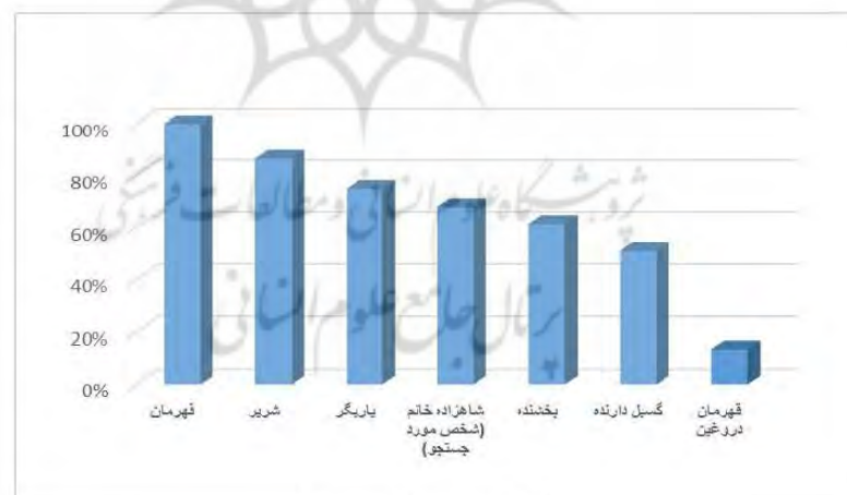
شکل ۲. بسامد شخصیت‌ها

خویشکاری‌های قصه‌های کردی را کنشگران هفت حوزه عملیات برعهده دارند. از میان این کنشگران، «قهرمان» با حضور در همه قصه‌ها بیشترین بسامد و «قهرمان دروغین» با حضور در ۲۱ قصه کمترین بسامد را دارد. بسامد حضور دیگر کنشگران به این صورت است: شیر در ۱۳۴ قصه، یاریگر در ۱۱۶ قصه، شاهزاده خانم یا شخص مورد جستجو (شخص مورد) در ۹۵ قصه، بخشنده در ۷۹ قصه، گسیل‌دارنده در ۷۹ قصه.