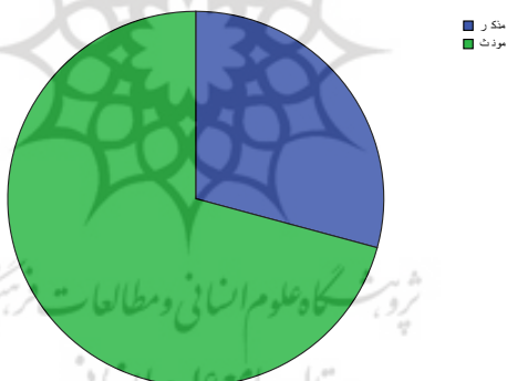
نمودار شماره ۱. توزیع فراوانی معلمان براساس جنسیت