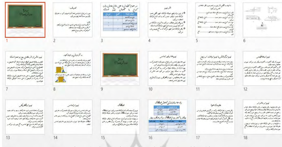
شکل ۲: ارائه خطی و نرم‌افزار PowerPoint (نمونه‌ی استفاده شده)

با توجه به مطالبی که در بالا ذکر شد می‌توان اظهار داشت که ارائه شبکه‌ای در مقایسه با ارائه خطی بر پیشرفت تحصیلی علوم تجربی ششم ابتدایی موثر است. این پژوهش بر آن است که این ادعا را مورد بررسی قرار دهد. بنابراین سوال اصلی پژوهش مورد نظر این است: آیا ارائه شبکه‌ای در مقایسه با ارائه خطی بر پیشرفت تحصیلی علوم تجربی ششم ابتدایی اثر بخش است؟ به این منظور ۳ فرضیه مورد مطالعه قرار گرفت که ارائه شبکه‌ای در مقایسه با ارائه خطی بر پیشرفت تحصیلی مفاهیم علوم تجربی ششم ابتدایی (یادداری، درک و کاربری) موثر است که در قسمت یافته‌ها به آنها اشاره شده است.