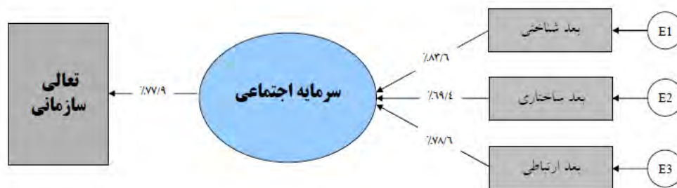
شکل ۲- مدل نهایی پژوهش با استفاده از نرم افزار لیزرل

همانطور که می‌دانیم، نرافزار LISREL یک سری شاخص‌هایی برای سنجش نیکویی برازش مدل تدوین شده ارائه می‌دهد. شاخص‌های مربوط به مناسب بودن برازش مدل شامل \chi^2 ، GFI (شاخص نیکویی برازش) و AGFI (شاخص تعدیل شده نیکویی برازش) می‌باشند. بنا به تعریف، مدلی از برازش مطلوب برخوردار است که نسبت \chi^2 به df آن کوچکتر از ۳ باشد و همچنین GFI و AGFI آن به سمت عدد یک میل کند.