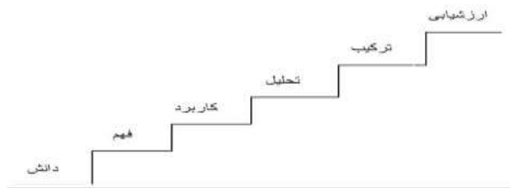
شکل ۱. سطوح مختلف حیطه شناختی

می‌رویم، حوزه فعالیت‌های شناختی عمیق‌تر می‌شود که این سطوح پلکانی، در شکل ۱ به تصویر کشیده شده است.