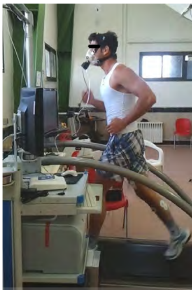
شکل ۱. پروتکل دویدن با استفاده از نوارگردان و دستگاه گاز آنالایزر متامکس در آزمایشگاه شبیه‌سازی شده به دویدن در یک مسابقه دو ۵۰۰۰ متر استقامت

هنگام اجرای آزمون، همچنان که سرعت دویدن افزایش می‌یافت، اکسیژن مصرفی نیز قبل از رسیدن به حالت پایدار افزایش پیدا کرد. برای بررسی تغییرات اکسیژن مصرفی در مجموع پروتکل به این صورت عمل شد که اکسیژن مصرفی دو دقیقه انتهایی تمام آزمودنی‌ها برای هر سه سرعت ۴، ۶ و ۸ کیلومتر بر ساعت انتخاب شد. در نتیجه برای هر وزن یک ستون از داده‌های اکسیژن مصرفی به دست آمد. با مقایسه اکسیژن مصرفی کل دوره آزمون در هر وزن، به مشاهده اثر تغییرات وزن کفش بر میزان تغییرات اکسیژن مصرفی و در نتیجه اقتصاد دویدن پرداخته شد. اقتصاد دویدن از طریق محاسبه میانگین اکسیژن مصرفی دو دقیقه انتهایی هر مرحله، در صورتی که به حالت پایدار می‌رسید، تخمین زده شد. میانگین اکسیژن مصرفی به دست آمده، هزینه اکسیژنی را که برای رسیدن به آن سرعت نیاز است نشان می‌دهد که می‌تواند بین دوندگان مقایسه شود. مصرف اکسیژن کمتر برای رسیدن به یک سرعت مشخص نشان‌دهنده دویدن اقتصادی‌تر است. برای محاسبه OUES از روش بابا و همکاران (۱۹۹۶) استفاده شد (۱۶) که در آن اکسیژن مصرفی (میلی لیتر بر دقیقه) روی محور عمودی و تهویه کل (میلی لیتر بر دقیقه بر کیلوگرم) در تابع لگاریتم روی محور افقی قرار می‌گیرد. شیب خط معادله یک مجهولی ارتباط دو محور افقی و عمودی به عنوان OUES در نظر گرفته می‌شود (معادله ۱) (۱۴، ۱۵).