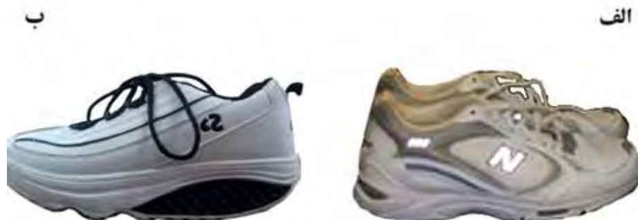
شکل ۱- الف: کفش کنترل؛ ب: کفش ناپایدار

کفش‌های تحت بررسی در این پژوهش در اندازه‌های ۴۲ تا ۴۴ برحسب اندازه پای آزمودنی‌ها تهیه شدند که شامل کفش کنترل (New Balance) و کفش ناپایدار (Perfect Steps- TM-030709 VP) بود (شکل ۱). این کفش‌ها به منظور مقایسه تأثیر شکل هندسه زیره کفش بر متغیرهای مرتبط با نیروی عکس‌العمل زمین انتخاب شدند. کفش ناپایدار انحنایی در راستای قدامی - خلفی دارد؛ درحالی که کفش کنترل دارای زیره معمولی بود.