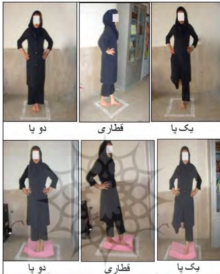
شکل ۲. سیستم شمارش تعداد خطای بالانس اجرا شده بر روی سطح سفت (بالا) و بر روی سطح نرم (پایین)

برای هر وضعیت به مدت ۵ ثانیه. قبل از اجرای آزمون، خطاها برای هر آزمودنی توضیح داده می‌شد و هر آزمودنی برای آشنایی با آزمون یکبار تست مورد نظر را به طور آزمایشی اجرا می‌کرد.