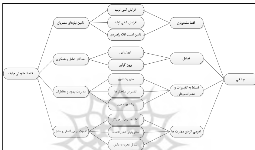
نمودار شماره (۲) - مدل مفهومی اقتصاد مقاومتی چابک

در نمودار ترسیم‌شده شماره (۲) ابعاد چابکی سازمان به‌عنوان عوامل دستیابی به مؤلفه‌های اقتصاد مقاومتی و در نتیجه افزایش مقاومت اقتصادی سازمان‌ها معرفی شده است.