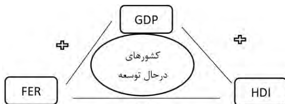
نمودار ۴. خلاصه روابط بلندمدت سه متغیر اصلی مدل در کشورهای در حال توسعه