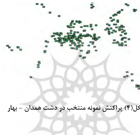
شکل (۴) پراکنش نمونه منتخب در دشت همدان - بهار

شدند. تصویر شماره (۴) مکان چاه های نمونه را نشان می دهد. با مراجعه به بهره برداران این چاه ها پرسش هایی در زمینه ویژگی های چاه و اطلاعات زراعی مطرح شده است. لازم به یادآوری است اطلاعات مربوط به میزان دبی چاه، سطح ایستابی، میزان برداشت و دیگر اطلاعات مانند ساعت های آبکشی و شمار روزهای بهره برداری در طی سه سال از سازمان آب منطقه ای استان گردآوری شده است