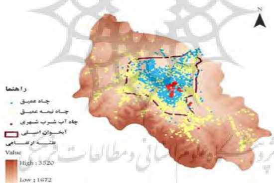
شکل (۳) پراکنش چاه های مورد بهره برداری در دشت همدان - بهار

پس از حذف روستاهایی که تنها دارای کشت دیم هستند، از دیگر روستاهای هر دهستان بر پایه چاه های موجود و به نسبت کل نمونه، شمار چاه مورد بررسی به صورت کاملا تصادفی مشخص