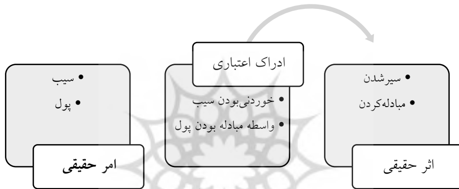
شکل ۱: چستی اعتباریات و نقش آن در زندگی

اعتباریات در ذهن انسان به‌صورت ادراک‌های اعتباری ظاهر می‌شود. ادراک‌های اعتباری، فرض‌هایی است که ذهن به‌منظور رفع احتیاج‌های حیاتی، آنها را ساخته و جنبه وضعی، قراردادی و فرضی دارد و با واقع و نفس‌الامر سروکاری ندارد» (طباطبایی، ۱۳۶۷، ص ۱۳۸). ادراک‌های اعتباری در عالم خارج هویت‌های اعتباری را پدید می‌آورد. این هویت‌های اعتباری وجود خارجی ندارند؛ اما از واقعیت خارجی منفصل نیستند؛ به‌طور مثال در عالم خارج چیزی به‌عنوان پول، وجود خارجی ندارد؛ اما این هویت اعتباری در اتصال با ماده که همان تکه کاغذ یا یک فلز است، پدید آمده است (اولیایی، ۱۳۸۹، ص ۹۹).