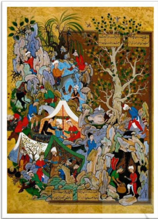
شاهزاده سلطان ابراهیم میرزا و همسرش به مشهد).

۳. سلطان ابراهیم میرزا صفوی که در شعر و شاعری طبعی لطیف داشت، تخلص شعری جاهی را برای خود برگزیده بود. ولی قلی خان شاملو و منشی قمی از زمره مورخانی هستند که به این امر اشاره کرده‌اند (شاملو، ۱۳۷۲: ۹۹/۱؛ منشی قمی، ۱۳۸۲: ۶۳۶/۲).