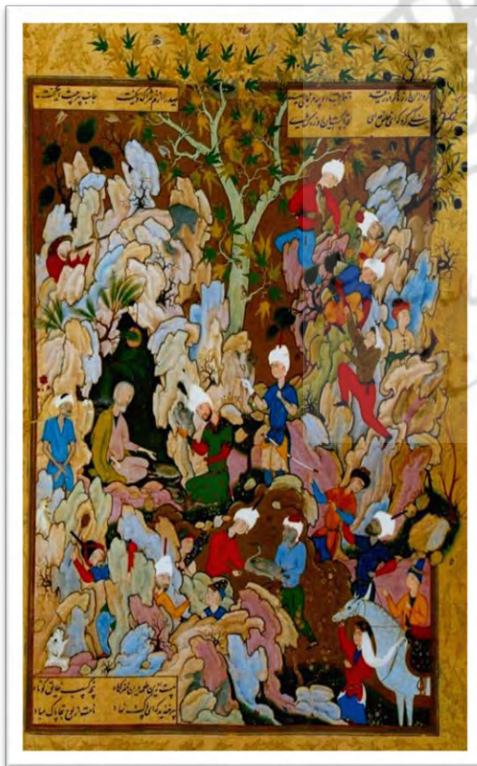
نگاره پیر فرزانه اثر میرزا علی

تصاویر ضمیمه برگرفته از (شرو سیمپسون، ۱۳۸۲).