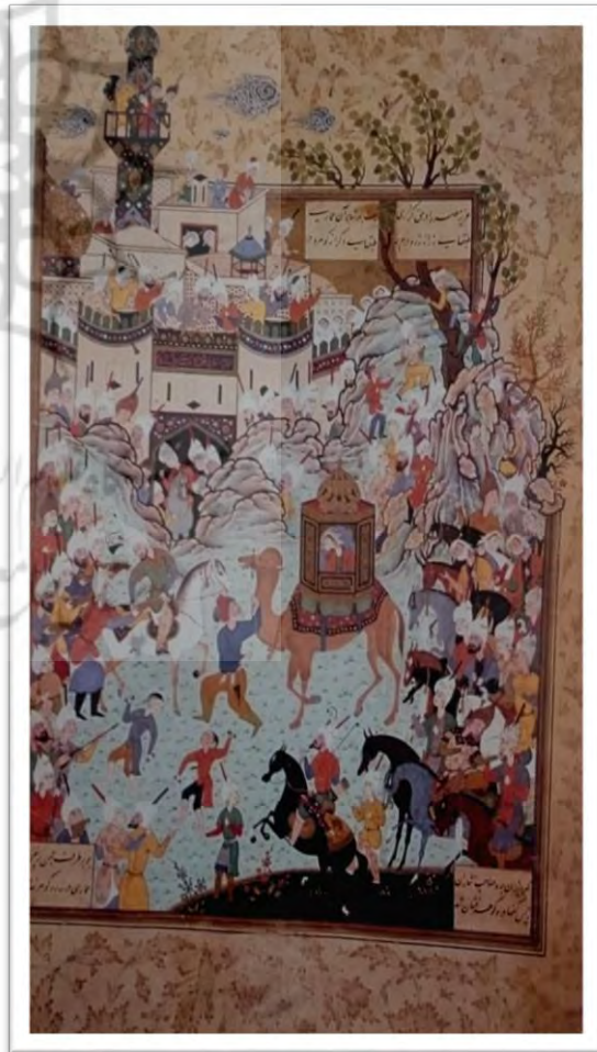
نگاره ورود عزیز و زلیخا به مصر (نماد ورود نجات یوسف از چاه اثر مظفر علی نقاش