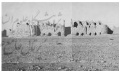
تصویر ۳: نمای کاخ مرکزی لشکری بازار