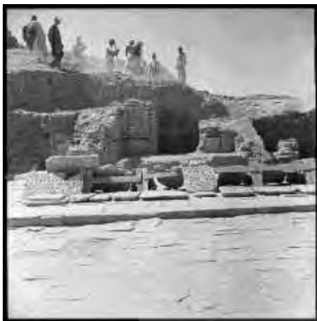
تصویر ۶: صحن کاخ مسعود سوم با کفپوش مرمری و ازاره‌های یافت شده