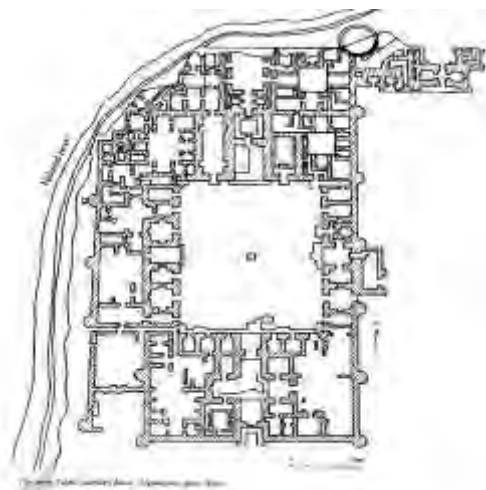
تصویر ۲: پلان کاخ بزرگ یا جنوبی