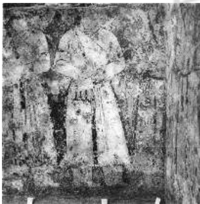
تصویر ۸: شمایل سربازان غزنوی بر روی نقاشی‌های ازاره