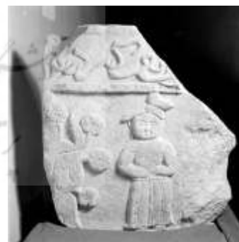
تصویر ۱۳: قابند تزئینی مرمر، صورت مغولی در کنار درخت