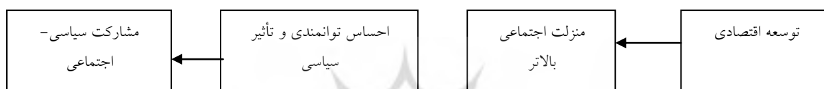
شکل ۱- مسیر تأثیر متغیرهای اقتصادی-اجتماعی بر میزان مشارکت

از دیدگاه فوق، مشارکت سیاسی و اجتماعی، بیشتر متأثر از مداخله و همکاری افراد در فعالیت‌ها، تشکل‌ها و سازمان‌هاست؛ یعنی میزان عضویت و همکاری فعال در گروه‌ها، انجمن‌ها، اجتماعات و نهادهای مردمی، احزاب سیاسی، نوعی بینش و مسؤولیت فردی و جمعی برای فرد ایجاد می‌کند لذا تداوم همکاری و مشارکت، برای او حکم یک ضرورت یا حتی یک وظیفه و تکلیف انسانی می‌شود. در شکل ۱ مسیر تأثیر متغیرهای اجتماعی بر مشارکت مشخص شده است.