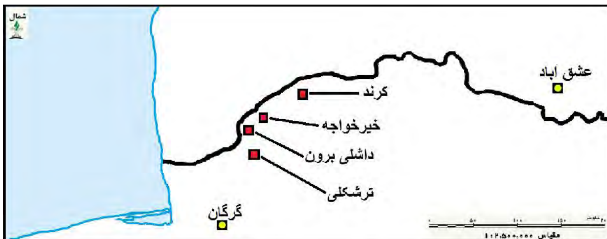
شکل شماره (۳): موقعیت مکانی روستاهای انتخاب شده در شهرستان گنبد کاووس