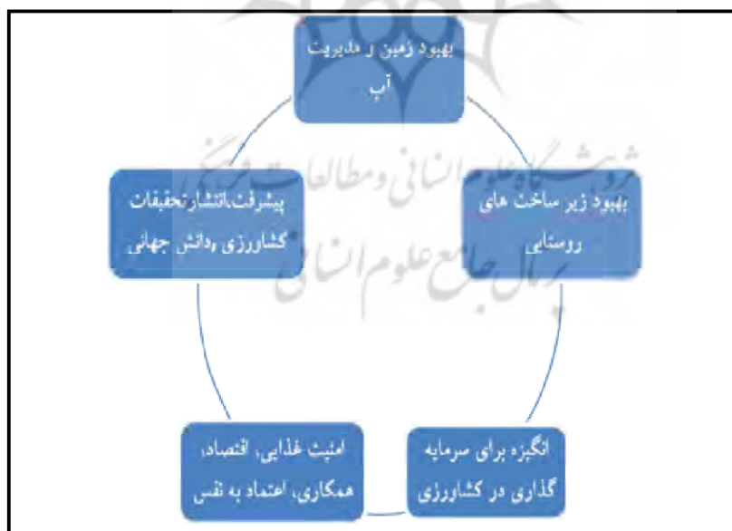
شکل شماره (۲): توسعه کشاورزی همه جانبه

شان بیشتر باشد، کشاورز قادر به تأمین پس‌انداز خواهد شد که بخشی از آن می‌تواند با اهداف تولیدی به سایر فعالیت‌های اقتصادی منتقل گردد؛ ۴- افزایش واردات مواد غذایی در شرایط محدودیت ارزی و نیاز به واردات تکنولوژی و تجهیزات مناسب صنعتی می‌تواند اثر بازدارنده و مهم بر روی رشد اقتصادی داشته باشد. برای جلوگیری از این امر، توسعه‌ی کشاورزی و افزایش تولید می‌تواند در کاهش هزینه‌های وارداتی و هم در بازیابی صادراتی در رشته‌های معین مواد اولیه‌ی صنایع داخلی و صنایع وارداتی مؤثر افتد؛ ۵- رشد بخش کشاورزی می‌تواند بازار و نیروی انسانی توانمند در اختیار توسعه‌ی ملی قرار دهد؛ بازار توانمندی که برای رشد اقتصاد ملی ضرورت دارد. با افزایش درآمد کشاورزان فعالیت‌های روستایی، توسعه و گسترش می‌یابد. همچنین قدرت خرید کشاورزان عامل اساسی برای توسعه‌ی بازار کالاهای صنعتی است و با تجاری شدن کشاورزی، دهقانان می‌توانند هزینه‌ی کالاهای صنعتی را کاهش دهند. کارآمدی کشاورزی و درآمد اضافی برای کشاورزان بهبود نسبی رفاه اجتماعی و اقتصادی در مناطق روستایی را به بار می‌آورد و خانوارهای روستایی را به سمت استفاده از کالاهای مصرفی با دوام کشانده و تقاضا برای خدمات عمومی، اجتماعی، فرهنگی و بهداشتی را افزایش می‌دهد (رئیس‌دانا، ۱۳۸۰: ۸۶۷). با توجه به توانمندی‌های بخش کشاورزی و نقش مهم این بخش در اقتصاد روستایی، حرکت به سمت کشاورزی پایدار و حمایت از کشاورزی نقش اساسی در توسعه روستایی کشور خواهد داشت (رضوانی، ۱۳۸۳: ۲۵۳). برخی از مهم‌ترین تحقیقات صورت گرفته مرتبط با موضوع در جدول ۱ آورده شده است.