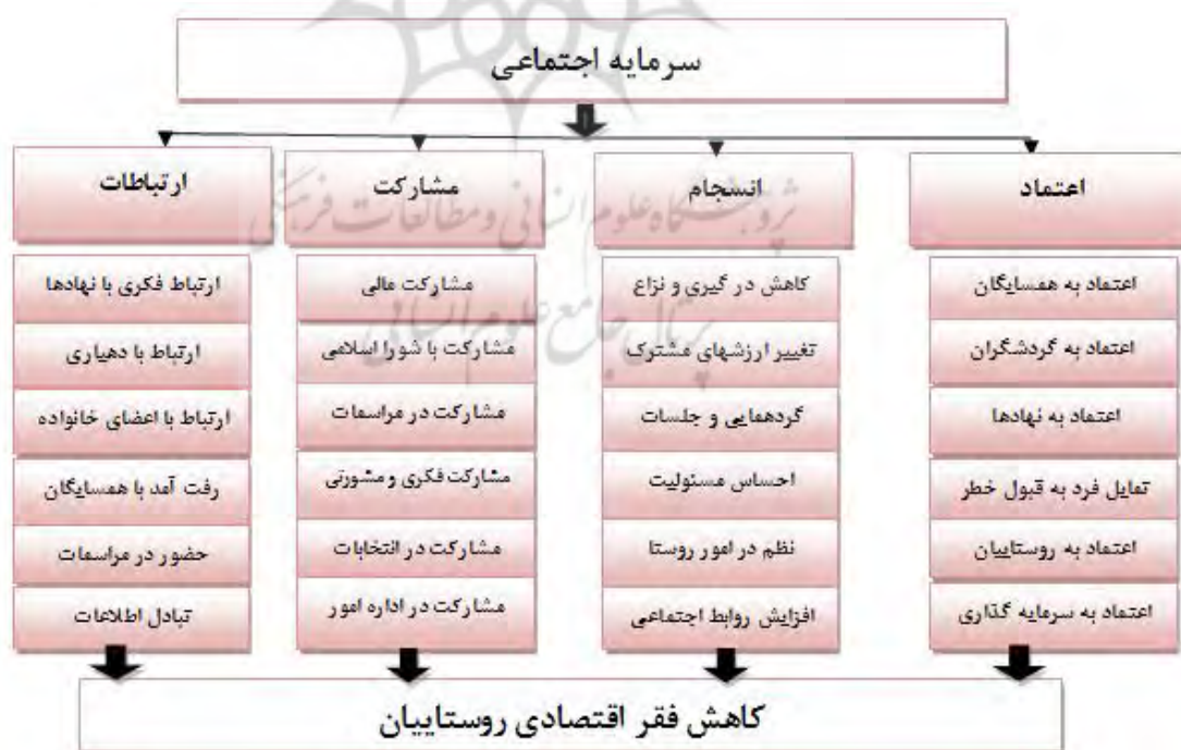
شکل شماره (۱): مدل مفهومی تحقیق