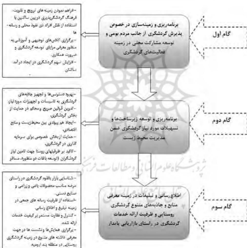
شکل شماره (۲): الگوی توسعه گردشگری در روستای بند

نهایت اینکه با ۹۵٪ درصد اطمینان می‌توان به وجود رابطه مستقیم بین دو عامل گسترش گردشگری و تغییر شاخص‌های اقتصادی در تفرجگاه بند معتقد بود. لذا نتایج این پژوهش با نتایج پژوهشی‌های قبلی مانند پژوهش بلیسل و هوی (۱۹۸۰)، کوکیور (۱۹۹۶)، بدری و همکاران (۱۳۸۸) یکسان می‌باشد.