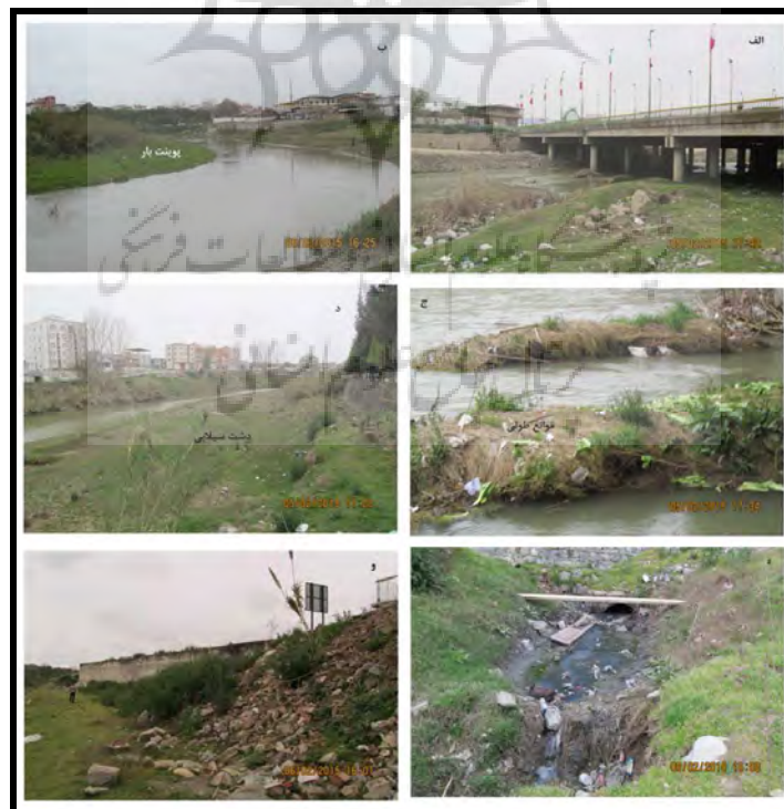
شکل ۲: تصاویر بابل رود، الف) رسوبگذاری در پایه پل، ب) پوینت بار، ج) موانع طولی درون کانالی، د) دشت سیلابی، ه) پرشدگی کالورت، و) تخلیه نخاله شهری و کاهش عرض رود

مطالعات یمانی و همکاران (۱۳۹۴) در بابل رود که با استفاده از روش متساوی البعد انجام شده است نشان می‌دهد که الگوی رود در بازه مورد مطالعه تغییرات کمتری را طی دوره‌های مورد بررسی تجربه نموده است. شاخص پایداری کانال رود در بازه‌های مورد مطالعه بین ۰/۱۱ تا ۰/۱۸ متغیر بوده است. با توجه به اینکه مقادیر کمتر از ۰/۲۵ نشان‌دهنده‌ی شرایط پایدار است لذا همه بازه‌ها در حالت تعادل یا پایدار قرار دارند.