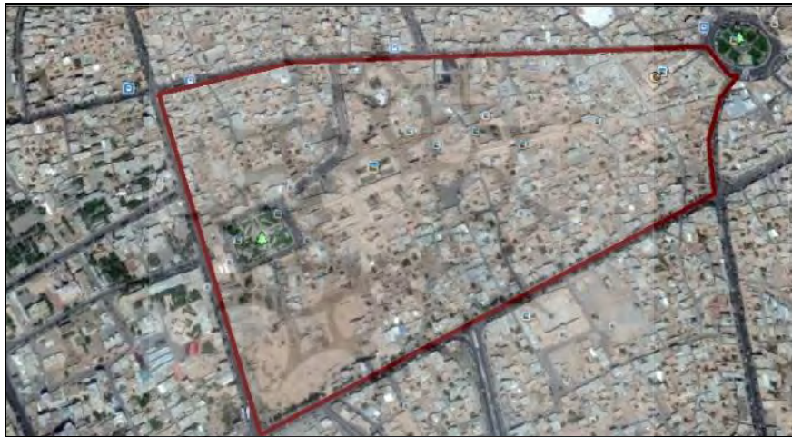
شکل ۱- محدوده مورد مطالعه بر روی GoogleEarth

وکیل، وکیل، بازار اختیاریه، کاروانسرای گلشن، میدان گنجعلی خان، مسجد گنجعلیخان، کاروانسرای گنجعلی خان، حمام گنجعلی خان، آب انبار گنجعلی خان، موزه سگه، موزه مردم شناسی، چهارسوق بازار، بازار ارگ، بازار مسگرها، مدرسه علمیّه محمودیه، مسجد حاج آقاعلی، بازار حاج آقاعلی، آب انبار حاج آقاعلی، مجموعه قیصریه ابراهیم خان، مجموعه قیصریه ظهیرالدوله، حمام ابراهیم خان ظهیرالدوله، مدرسه علمیّه ابراهیمیّه، کاروانسرای میرزا حسن خان، قیصریه ملّا محمد صالح، تکیه مدیرالملک و تکیه گلباز خان می باشد (شکل ۱ و ۲).