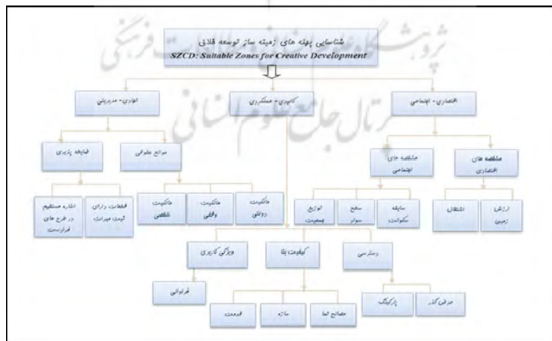
شکل ۳- سلسله‌مراتب عوامل، معیارها و شاخص‌های مورد استفاده در مدل شناسایی پهنه‌های زمینه‌ساز توسعه خلاق بافت فرسوده با رویکرد گردشگری

یکی از بازدارنده‌های اصلی توسعه موانع حقوقی به‌ویژه مسائل ناشی از مالکیت و تصرف قطعات است. در این میان بر مبنای نتایج به‌کار رفته در پژوهش مشابه و مدل تدوین شده، مالکیت شخصی بیشترین مقاومت را در برابر توسعه مالکیت وقفی در درجه بعدی و مالکیت دولتی کمترین مقاومت را دارد. این نظر مبنای تولید لایه‌های اطلاعاتی و وزن‌دهی آنهاست. در این مرحله از طریق اعمال منطق ارزش‌گذاری (Index Overlay) در محیط ArcGIS قطعات مالکیتی بر اساس هر شاخص به‌طور جداگانه وزن‌دهی می‌شوند و نقشه‌هایی به‌دست می‌آیند که دامنه‌ای از اعداد را در بر می‌گیرند. به‌عنوان مثال در وزن‌دهی عامل عرض گذر، معابری که بیشترین عرض را داشته‌اند، وزن ۹ گرفته و بر عکس گذرهایی که کمترین عرض را داشته، وزن ۱ گرفته‌اند. خروجی ارزش‌گذاری‌ها باید به صورت رستری ارائه گردد.