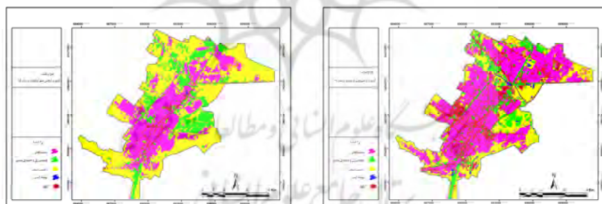
شکل ۳- کاربری اراضی شهر کرمانشاه در سال ۱۳۸۹ شکل ۲- کاربری اراضی شهر کرمانشاه در سال ۱۳۶۵

کاربری‌ها را در مرحله پیش از طبقه‌بندی و بعد از طبقه‌بندی برداشت شد و با در نظر گرفتن تفکیک‌پذیری باندها، با توجه به این‌که الگوریتم‌های طبقه‌بندی پیکسل پایه بر پایه ماتریس واریانس و کوواریانس عمل می‌کنند؛ باندهای مناسب برای طبقه‌بندی منظور شد. بعد از ارزیابی احتمالات در هر کلاس، پیکسل‌ها به کلاس‌هایی که بیشترین شباهت را دارند، اختصاص می‌یابند و نقشه‌های موردنظر با استفاده از نرم‌افزار ENVI و روش طبقه‌بندی نظارت شده از نوع بیشترین احتمال، طبقه‌بندی تصاویر به دست آمد. پس از تبدیل نقشه طبقه‌بندی از حالت رستری به برداری و در نهایت تبدیل به شکل GeoDataBase، وارد محیط ArcGIS9.3 شده و به صورت نقشه‌های مورد نظر در آمده، سپس با استفاده از نقشه و جداول اطلاعاتی مربوط به آنها، اعداد بدست آمده برای هر یک از کاربری‌ها محاسبه گردیده است و محاسبات انجام شده بیانگر چگونگی تغییرات کاربری‌ها در طی این دو دوره (۲۴) ساله و میزان افزایش کاربری‌های شهری و کاهش کاربری‌های کشاورزی و باغی می‌باشد. همچنین نقشه‌های کاربری اراضی منطقه در طی دو دوره ۱۳۸۱، ۱۳۹۵ با تمام انواع کاربری‌ها مورد بررسی قرار گرفته است تا میزان افزایش کاربری‌های گردشگری نسبت به سایر کاربری‌های شهری مورد مقایسه قرار گیرد.