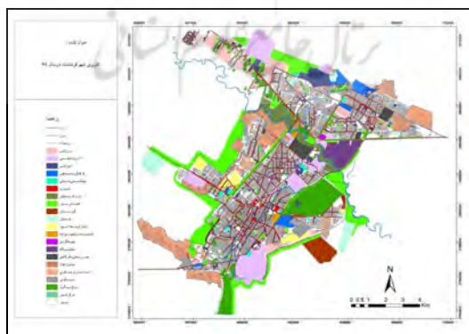
شکل ۵- پیش‌بینی نقشه کاربری شهر کرمانشاه برای سال ۱۳۹۵