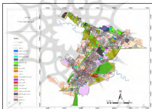
شکل ۴- نقشه کاربری شهر کرمانشاه در سال ۱۳۸۱

مساحت کاربری تجاری نیز ۸۰۴۲۰۹ بوده که بنا بر نقشه پیش‌بینی کاربری شهر، در سال ۱۳۹۵ به ۲۲۷۴۹۸۳ افزایش خواهد یافت (جدول ۶ و شکل ۶). یکی از دلایل آن در حال اجرا بودن طرح ساماندهی بافت فرسوده و مرکزی شهر و احداث هر چه بیشتر مجتمع‌های تجاری در این قسمت شهر، توجه بیشتر مردم به خرید در این منطقه به دلیل مرکزیت منطقه‌ای در بین استان‌های غربی کشور می‌باشد.