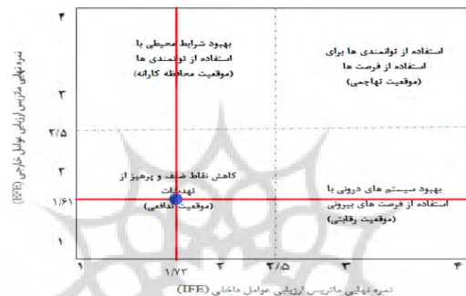
شکل ۲- ماتریس عوامل داخلی- خارجی (IFE)

پس از طی مراحل ذکر شده، نوبت به تشکیل ماتریس داخلی- خارجی می‌شود؛ در این ماتریس نمرات نهایی حاصل از ماتریس (IFE) و (EFE) برای تعیین موقعیت حکمروایی مورد استفاده قرار می‌گیرد. با توجه به این ماتریس، شکل (۲)، موقعیت حکمروایی در خرم‌آباد از میان چهار موقعیت مشخص شده، در بدترین موقعیت یعنی حالت تدافعی، قرار دارد این بدان معنی است که از یک طرف با نقاط ضعف داخلی و از طرف دیگر با تهدیدهای خارجی روبرو است. در این وضعیت اقداماتی که انجام می‌شود باید در راستای کاهش نقاط ضعف و پرهیز از تهدیدها باشد.